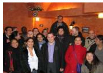
La voix des adoptés... Pour que les adoptés puissent s'exprimer !!