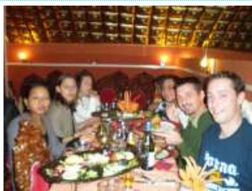
Une ambiance conviviale chez nos amis lyonnais...